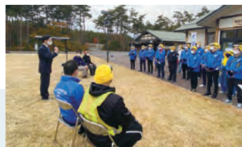
「ONE TEAM」久しぶりに青年部メンバーが勢揃い。