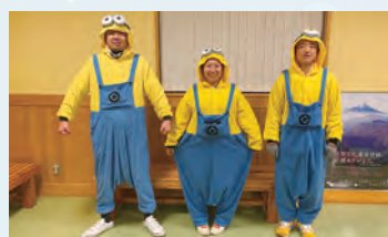
今年度に卒業を控えるメンバーが着ぐるみでお出迎え。