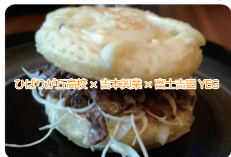
ひばりが丘高校 × 吉本興業 × 富士吉田 YEG

ひばりが丘高校うどん部、吉本興業と青年部がコラボして吉田のうどんバーガー(仮称)を開発。パンズにはうどんを練り込み、馬肉とキャベツ、うどんの汁で作ったジュレを乗せ、吉田のうどんがバーガーに！7月の市制祭で新商品として販売、大好評でした。これからも継続してイベント等で販売していく予定です。