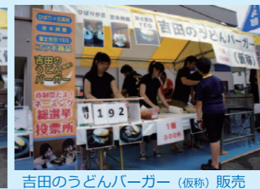
吉田のうどんバーガー(仮称)販売