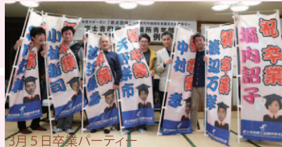
3月5日卒業パーティー

青年部は年々目に見えてしつかりした組織になっており、活躍の場を拡げています。青年部あつての商工会議所、青年部あつての富士吉田と言っても過言ではありません。これからも富士吉田市を盛り上げ、自慢の故郷を子どもたちにしっかりと継承するために、一緒に頑張りたいと思います。これからもよろしくお願いたします!