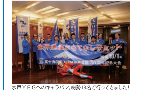
水戸YEGへのキャラバン。総勢13名で行って来ました!

4月11日茨城県水戸YEGの総会・懇親会にお邪魔にキャラバン隊として「世界遺産おもてなしサミット」のPR活動をしてきました。今後さらに6月末まで関東の県連を回ります。 ▼今後の予定▼ 5/17 神奈川県(平塚)、5/18静岡県(伊東)、5/25千葉県、5/26群馬県(藤岡)、6/18静岡県(富士)、6/30埼玉県(秩父)、未定栃木県