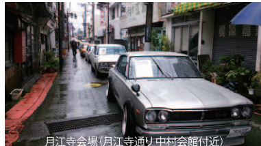
月江寺会場 (月江寺通り中村会館付近)