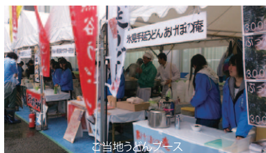
む当地うまいブース