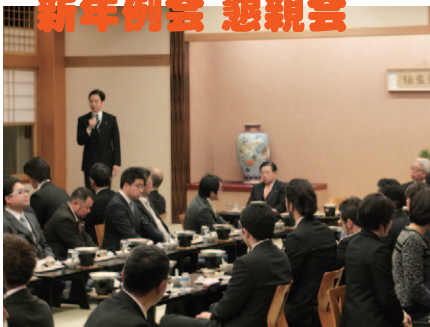
近隣からは、富士五湖JC、南都留中部商工会、甲府YEG、沼津YEG、三島YEG、富士宮YEGなども参加し盛り上がりしました。