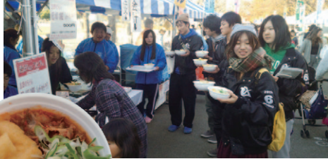
県民の日 物産展 (11月16・17日) 小瀬スポーツ公園で吉田のうどんをPR 今年は、ひばりが丘高校とコラボしたチゲスープをベースとしたうどんを販売。

また、サイコロゲームやスーパーボールすくいも運営し、ひばりが丘高校の生徒もボランティアとして参加。