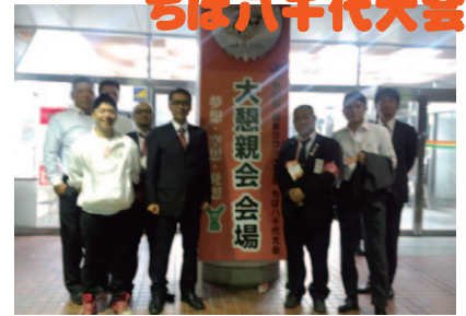
第33回関東ブロック大会 10月11日・12日