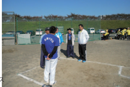
会員交流事業・ソフトボール大会 (埼玉県 熊谷 11月16日)