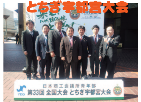
日本商工会議所青年部 第33回全国大会 とちぎ宇都宮大会 第33回全国大会 2月21日・22日