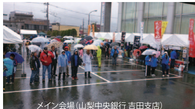
メイン会場 (山梨中央銀行 吉田支店)