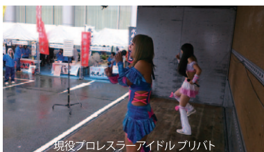
現役プロレスラーアイドルプリバト

国民文化祭のイベント、「吉田のうまいもの祭りin下吉田」を10月20日に開催しました。青年部イベントでは、珍しく「雨」というかはじめての雨。しかし、雨と吹き飛ばす青年部のアツい情熱と勢いでもちろん雨天決行。目玉は、全国のご当地うどんの有名店が大集合、伊勢うどんをはじめ各地から八店舗が出店しました。地元からは、ひばりが丘高校とコラボした吉田のワカメうどんを出店しました。また、東日本大震災でランドセル等を被災地支援にご協力頂いたお礼として現地の方がわざわざお越し頂き石巻復興牡蠣として三千個すべて完売しました。