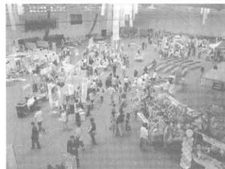
ア リ ー ナ