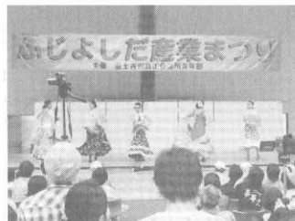
ステージイベント