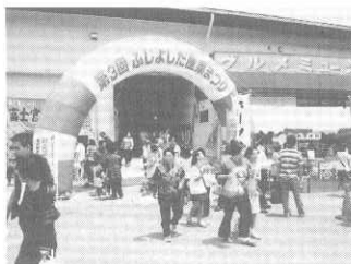
ア ー チ