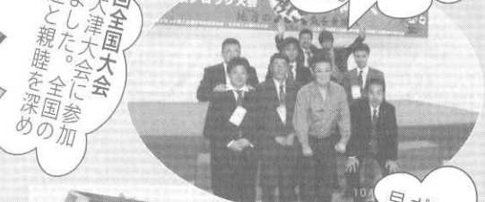
滋賀県大津大会 第28回全国大会 を経た者達と全国に参 加した。達と親睦を深め ました。