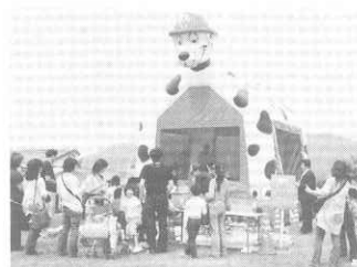
エ ア ド ー ム