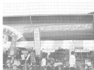
富士山グルメミュージアム