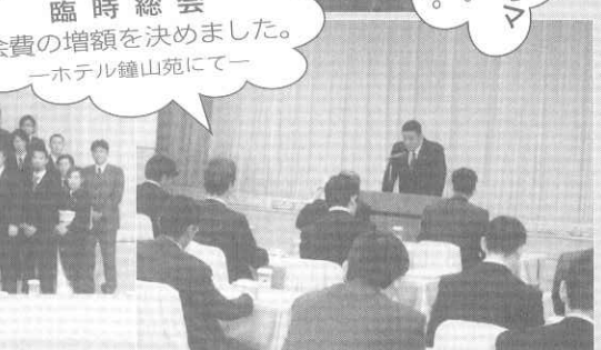
臨時総会 会費の増額を決めました。 —ホテル鐘山苑にて—