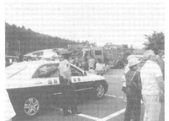
はたらく車大集合