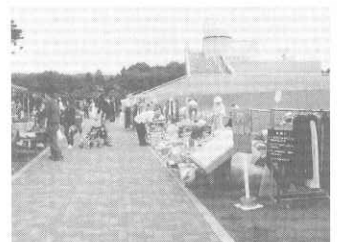
フリーマーケット