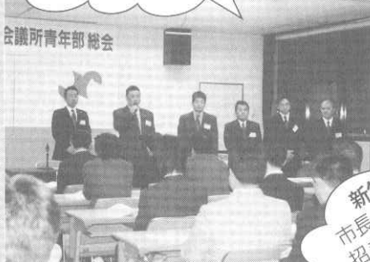
第22期富士吉田商工会議所 青年部通常総会開催