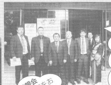
総代会 新年例会 市長・会頭・副会頭をお 招きして盛大に開催しま した。親睦が出来ました。