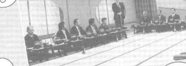
新年例会 輝かしい新年を部員一 同迎えられました。 ホテル鐘山苑にて